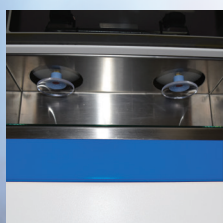
ローディングステーション