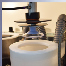
水洗いステーション