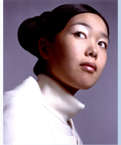
David Sims © 촬영